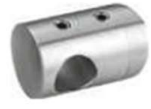
Conector intermedio poste-tubo para barandal de tubo de 1/2".

• Material: Acero inoxidable. • Acabado: Satín.