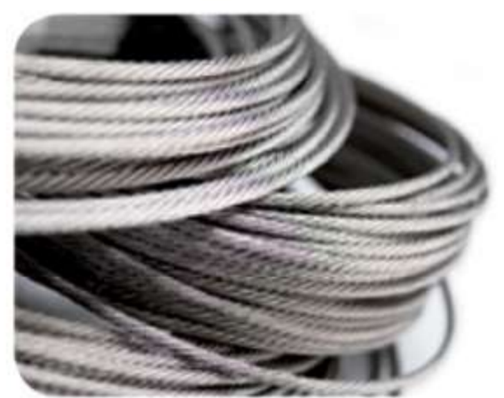
Cable tensor de 4mm de diámetro con 50m de largo (Modelo RP-1460).

Material: Acero inoxidable AISI 316 Acabados: Satinado