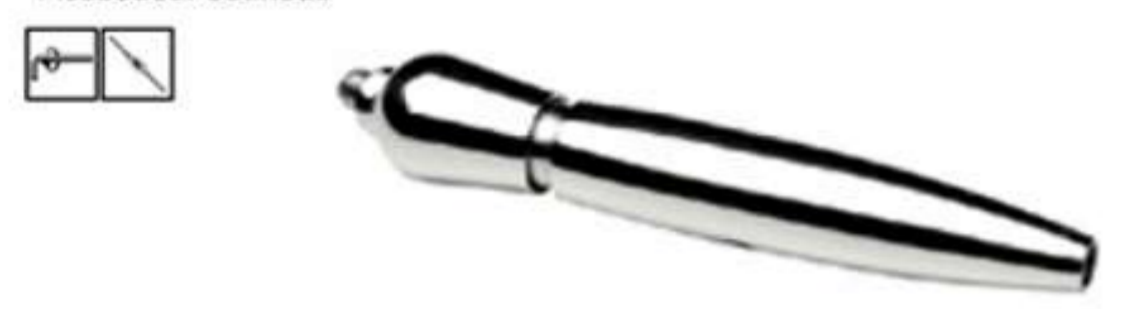
Conector tensor corto (Modelo SC-801) • Terminal.

Material: Acero inoxidable AISI 316 Acabados: Satinado