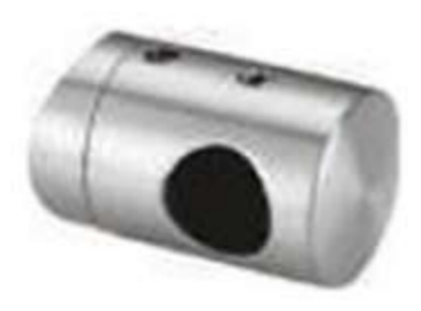
Conector de poste a barandal de tubo de 1/2". Base curva. Izquierdo.

Tubo de 1/2" (BRK 795) se vende por separado.