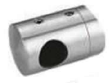
Conector de poste a barandal de tubo de 1/2". Base curva. Derecho.

Tubo de 1/2" (BRK 795) se vende por separado.