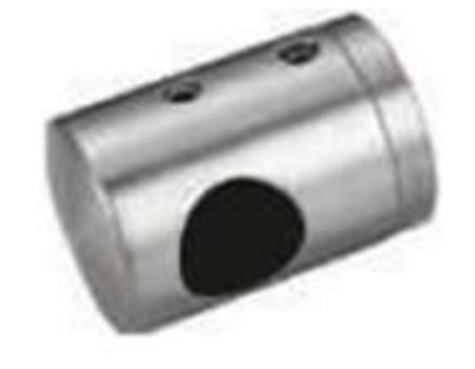
Conector de poste a barandal de tubo de 1/2". Base Plana. Derecho.

• Material: Acero inoxidable. • Acabado: Satín.