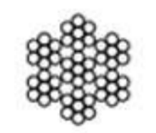
7 + 7 + 0 semi-flexible

Material: Acero inoxidable AISI 316 Acabados: Satinado