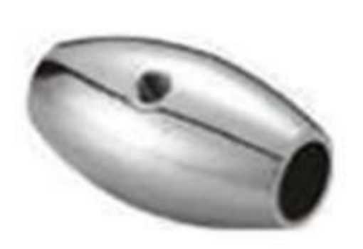
Conector ovoide intermedio para barandal de tubo de 1/2".

Tubo de 1/2" (BRK 795) se vende por separado.