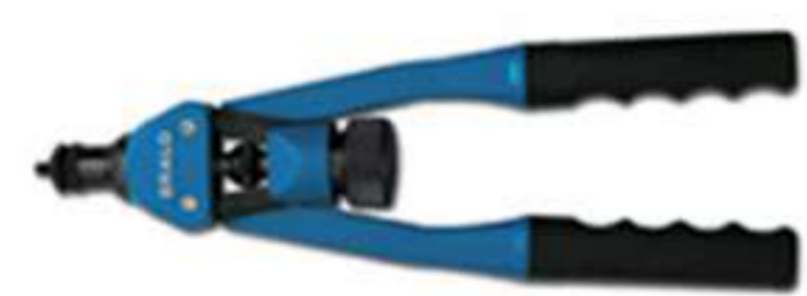
Remachadora para M-4, M-6 y M-8 (Modelo TR-308).

Tubo de 1/2" (BRK 795) se vende por separado.