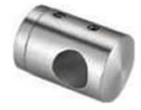
Conector intermedio base plana de poste a barandal de tubo de 1/2".

• Material: Acero inoxidable. • Acabado: Satín.