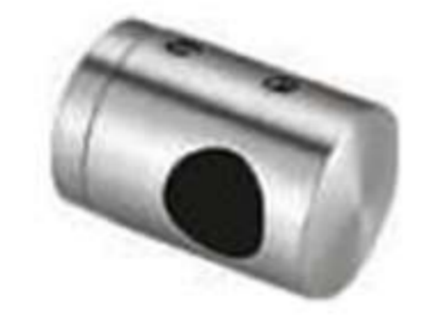
Conector de poste a barandal de tubo de 1/2". Base Plana. Izquierdo.

Tubo de 1/2" (BRK 795) se vende por separado.