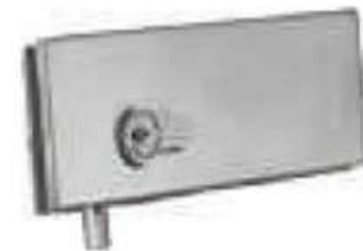
Chapa a piso con resaque. Acabado: Satín y cromo.