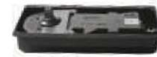
Bisagra hidráulica para 80 Kg. Medidas para perforación a piso: 100 x 266 x 51 mm.