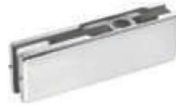
Herraje superior para punto de giro superior. Acabado: Satín y cromo.