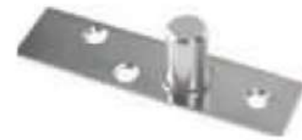
Punto de giro para herraje superior.