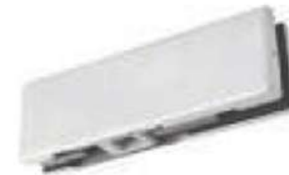
Herraje inferior para bisagra hidráulica. Acabado: Satín y cromo.